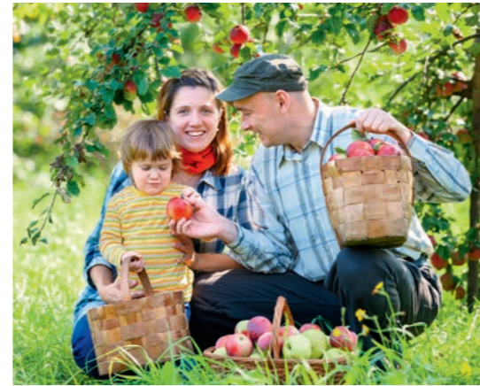
Pflanzen, ernten, wachsen lassen