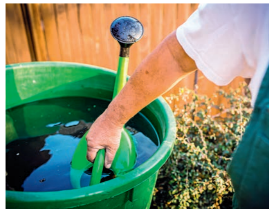
Regenwasser sammeln und im Garten nutzen.