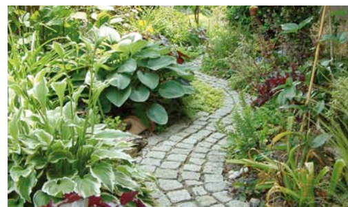
Boden nicht versiegeln, wasserdurchlässig Pflastern