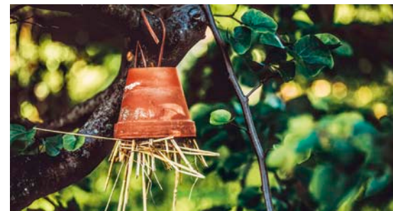
Unterschlupf für Nützlinge wie Ohrwürmer.