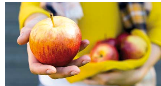
Lokale Sorten im Garten bewahren.