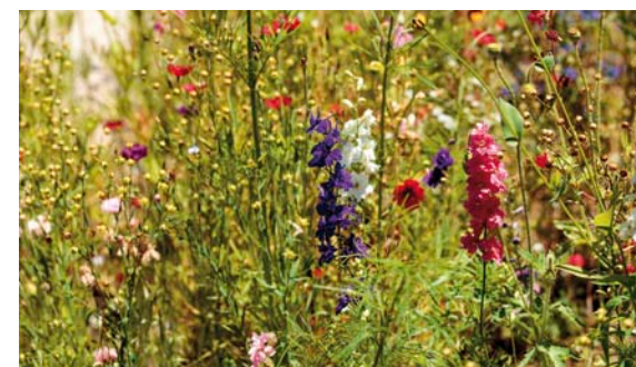
Standortgerecht pflanzen. Je vielfältiger, umso besser!

Immer mehr Flächen sind durch Beton oder Stein versiegelt. Das stört nicht nur den natürlichen Wasserkreislauf. Wichtige Lebensräume wie Magerwiesen, kleine Tümpel, Lehm- und Sandflächen und Ödland verschwinden und mit ihnen viele Tier- und Pflanzenarten. Gleichzeitig findet man in der freien Landschaft fast nur noch großflächige landwirtschaftliche Monokulturen. Das muss und kann anders werden!